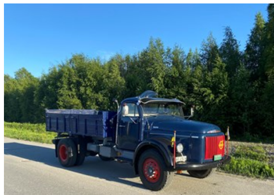
Den Blå Bilen av modell Volvo Viking från 1962.

Idag producerar Umeåfabriken hytter för fyra olika Volvomodeller: FM, FH, FH16, och FMX, från plåtulle till färdig hytt.