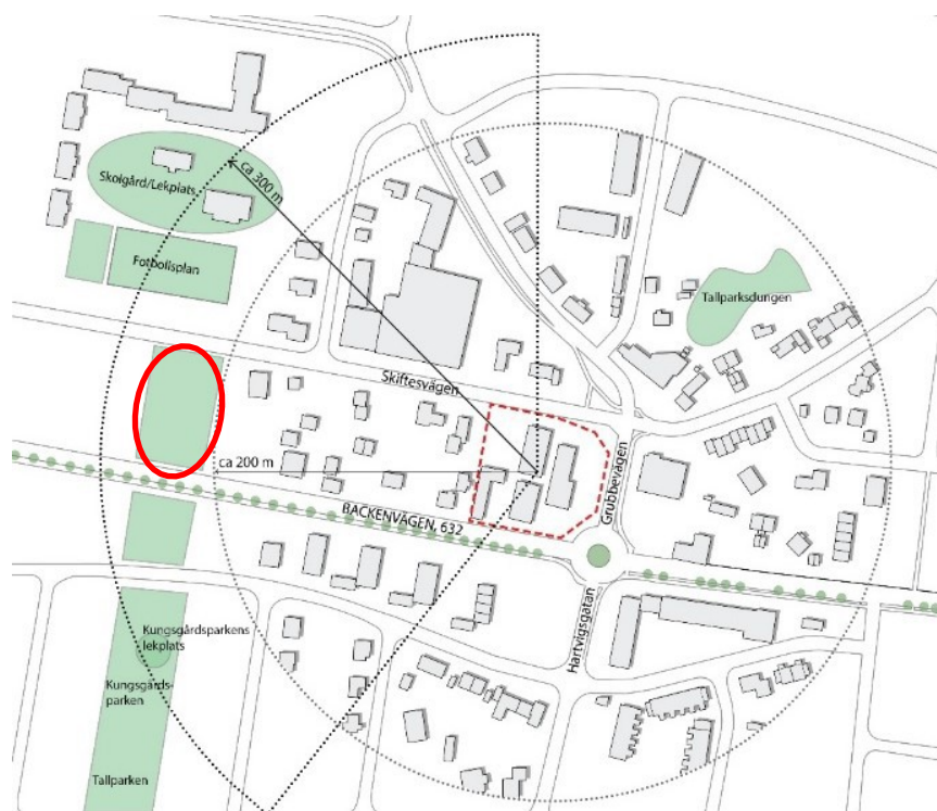
Översiktbild över grönområden i närheten av Syrenen med en grönytta markerat med rött.

Vid ett 100-års regn så finns det risk för översvämning längs Skiftesvägen mellan kvarteret Almen och planområdet. Vakin har därför påbörjat ett arbete med att ställa i ordning en dagvattendamm på en grönytta strax väster om planområdet. Grönyttan är inringat i rött på bilden ovan.